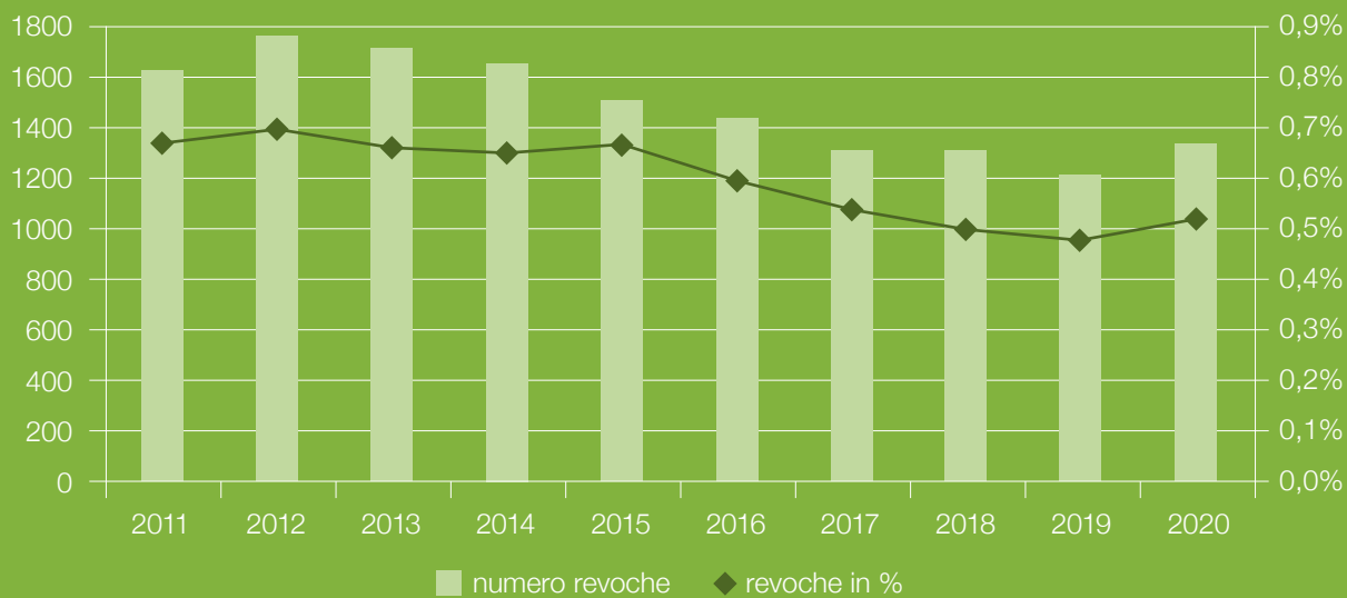
Fig. 3: Nell'anno in rassegna, il numero di revocazioni della licenza è leggermente aumentato